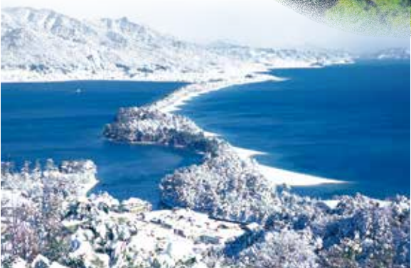
飞龙观回廊/胯下倒望/游乐场