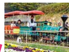
12 SL 办庆号