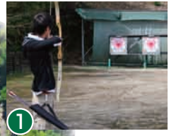
1 射箭 瞄准数米外的箭靶的正规射箭。我们会耐心地给您指导。