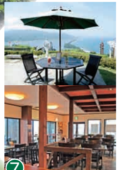
7 观光餐厅 您可以在享受极致美景的同时愉快的用餐。