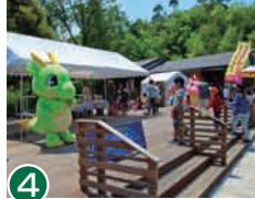
4 木质甲板 吹着清爽的风，享受片刻惬意时光。