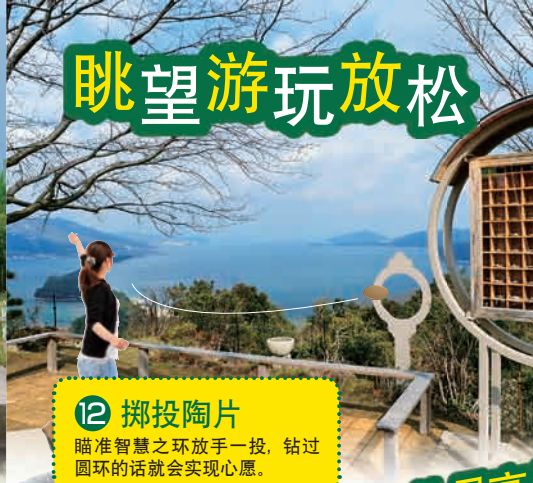
12 掷投陶片 瞄准智慧之环放手一投，钻过圆环的话就会实现心愿。