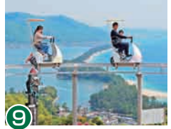
9 高空循环脚踏车 慢慢地边走边欣赏沿途美景，开放感爆棚的娱乐设施。