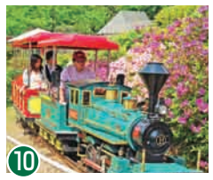
10 SL 办庆号 悠闲自在的地穿梭于园内中心区域的 SL 电车，让大人和小孩都能乐享其中。