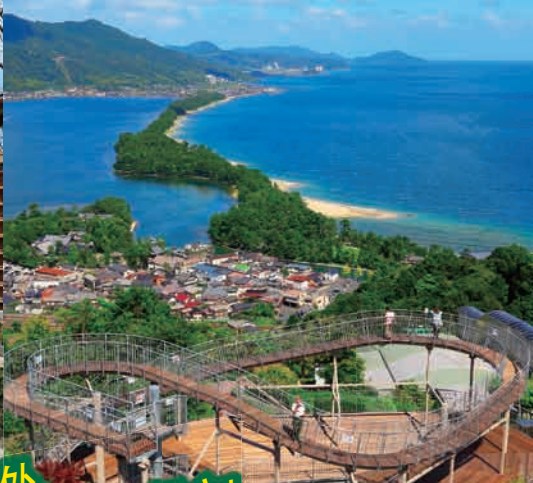
从最高处，在空中漫步天桥立！