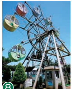
8 摩天轮 从海拔 150 米的高处享受绝美景色吧。