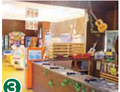
3 游戏厅 与家人和朋友一起玩游戏，一起拍限定大头贴纪念照吧。