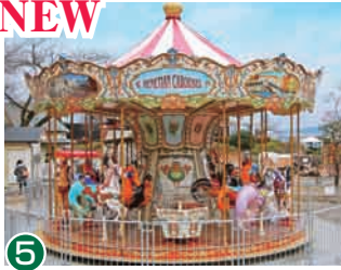
5 旋转木马 与幻想中的动物们一起驰骋。体验童话心境。