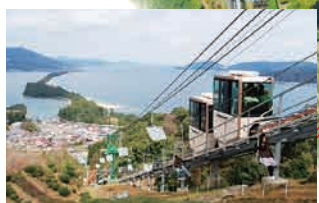
升降机 / 单轨电车 乘坐升降机您可以欣赏应季鲜花，乘坐单轨电车您可以在前往山顶游乐场时饱览天桥立的迷人景色。