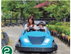
2 卡丁车 体验专用环形跑道的乐趣吧。