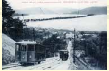
成相ケーブルカーより天橋立を望む