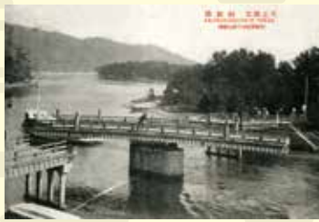
人の力で廻っていた頃の迴旋橋