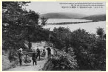
傘松の山路を登下する籠乗と天橋立の遠望