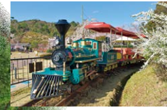
11 SL 弁慶號