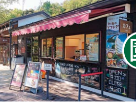
4 咖啡館 AMAHASHI STAND