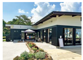
9 展望餐廳 請一邊欣賞最佳景觀，一邊度過用餐時光。