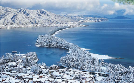
飛龍觀展望、胯下窺看、遊樂園